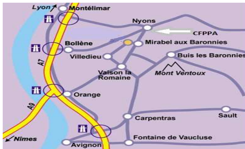
PLAN D'ACCÈS NYONS - DROME