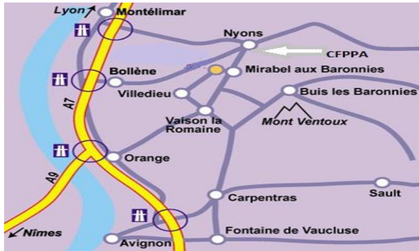
PLAN D'ACCÈS NYONS - DROME